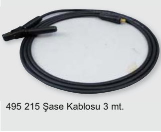
495 215 Şase Kablosu 3 mt.