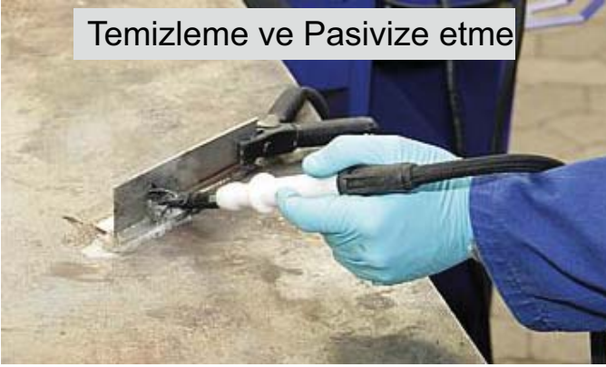
Temizleme ve Pasivize etme

Sadece TIG kaynağını değil Gazaltı kaynak yanığında temizler.