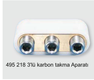
495 218 3'lü karbon takma Aparatı