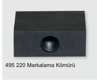
495 220 Markalama Kömürü