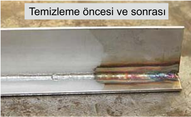
Temizleme öncesi ve sonrası