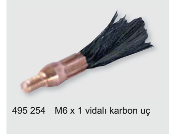
495 254 M6 x 1 vidalı karbon uç