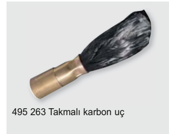
495 263 Takmalı karbon uç