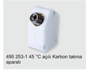
495 253-1 45 °C açılı Karbon takma aparatı