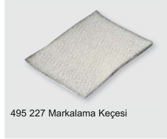
495 227 Markalama Keçesi