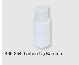
495 254-1 arbon Uç Karuma