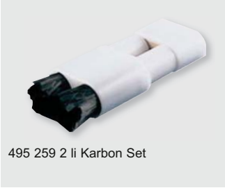
495 259 2 li Karbon Set