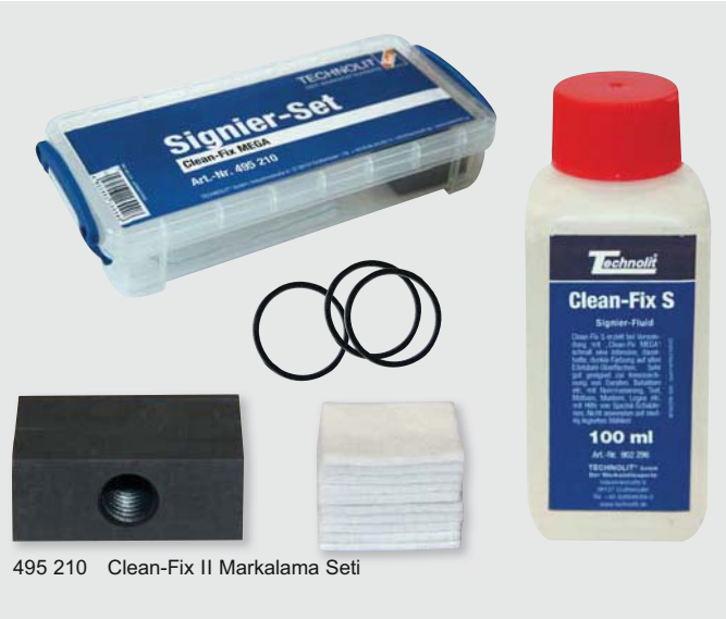
495 210 Clean-Fix II Markalama Seti