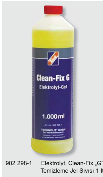
902 298-1 Elektrolyt, Clean-Fix „G“ Temizleme Jel Sıvısı 1 lt.