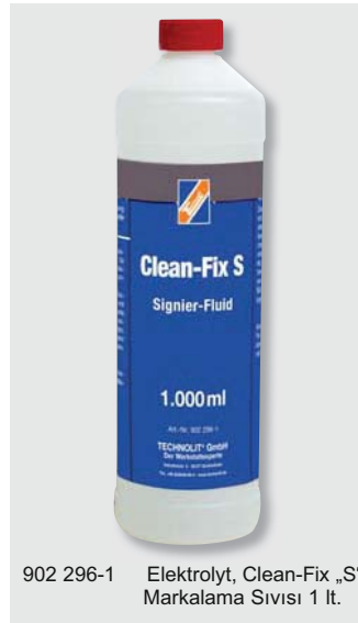
902 296-1 Elektrolyt, Clean-Fix „S“ Markalama Sıvısı 1 lt.