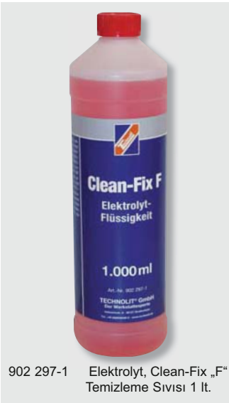
902 297-1 Elektrolyt, Clean-Fix „F“ Temizleme Sıvısı 1 lt.