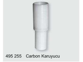
495 255 Carbon Karuyucu