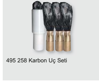
495 258 Karbon Uç Seti