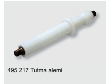
495 217 Tutma alemı