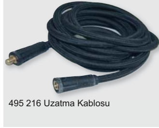
495 216 Uzatma Kablosu